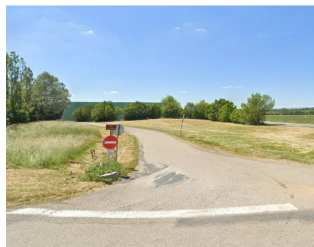
Vue STREET VIEW du secteur